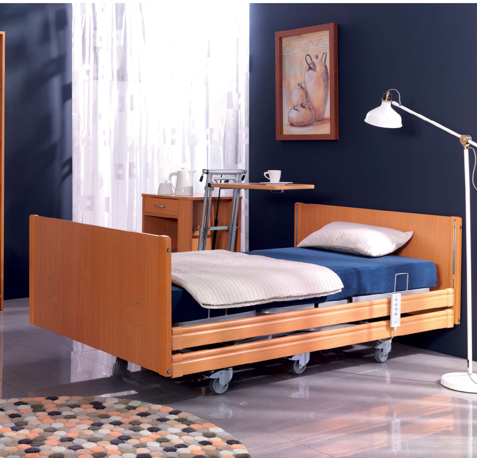
Na zdjęciu: łóżko PB XX4 w kolorze buk, w wykonaniu standardowym. Akcesoria: Szafka Rubens 2 w kolorze buk.

Dzięki wzmocnionej konstrukcji i zastosowaniu specjalnych siłowników do dużych obciążeń, łóżka z serii PB X4 przeznaczone są dla osób o zwiększonej wadze ciała, wymagających opieki długoterminowej. Bardzo stabilna konstrukcja łóżka gwarantuje bezpieczeństwo użytkowania, a wypełnione siatką metalową leże ułatwia jego dezynfekcję.