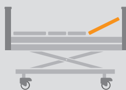
REGULACJA SEGMENTU PLECÓW