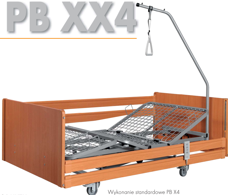
Wykonanie standardowe PB X4